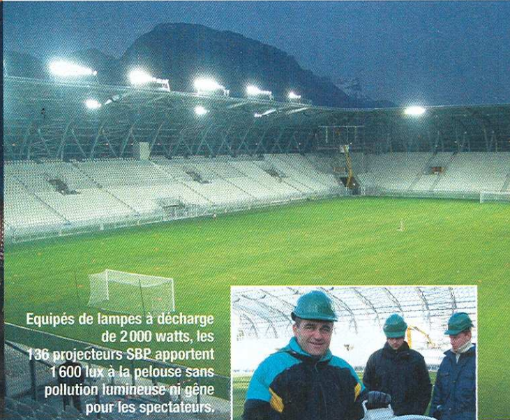
Equipés de lampes à décharge de 2 000 watts, les 136 projecteurs SBP apportent 1 600 lux à la pelouse sans pollution lumineuse ni gêne pour les spectateurs.